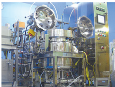
食品含浸装置 SBKSシリーズ