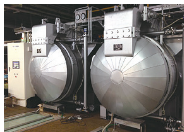
レトルト殺菌装置 RSシリーズ